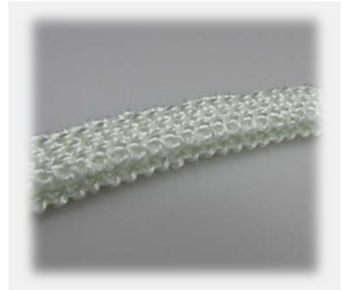
Dichtungsbänder in R/R Double Jersey seals band