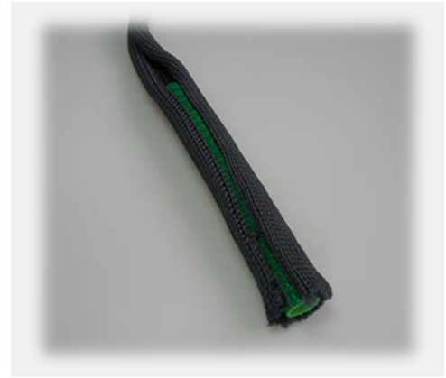
Offener Schutzschlauch Open protection half pipe