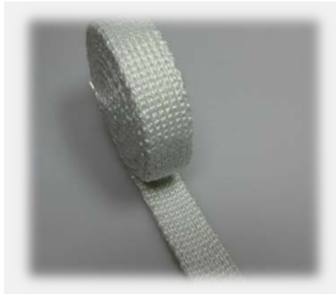
Dichtungsbänder in R/R Double Jersey seals band