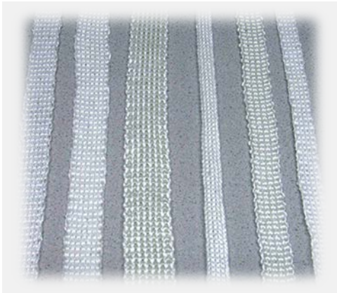
Dichtungsbänder in R/R Double Jersey seals band