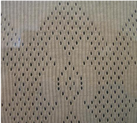
Transfer Muster Transfer Pattern