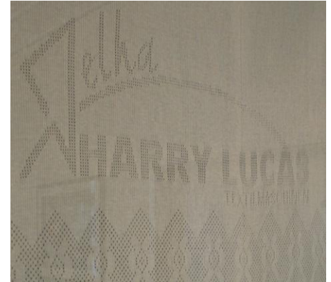
Lochmuster 2:2 Hole-Pattern 2:2