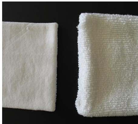
Sample plush fiber dye-test Plüschmuster