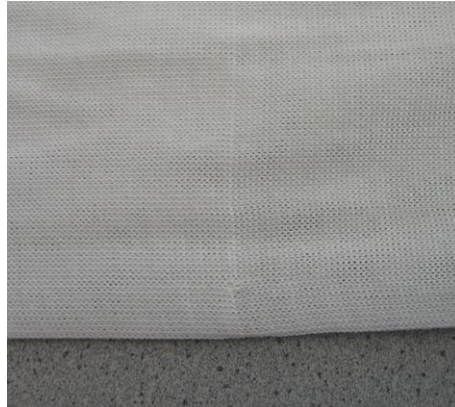
Sample with markings Muster mit Markierung