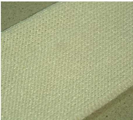
Sample rough 1,75 gauge Muster in 1,75 Teilung