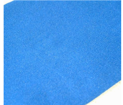
Sample fine 44 gauge Muster in 44er Teilung