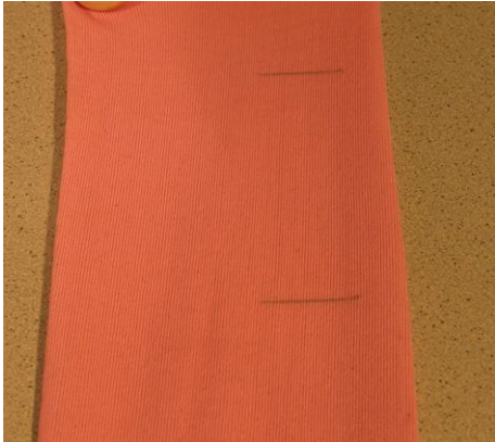
Sample with markings Muster mit Markierung