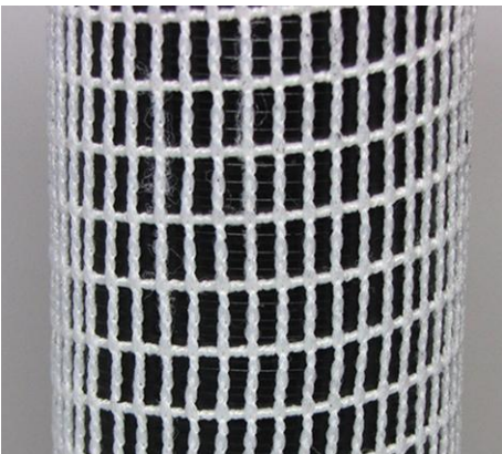
Schweinebratennetz Packing net for porkmeat