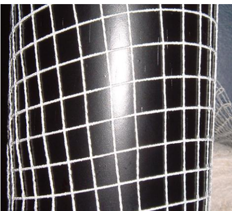
hinterlegt lay behind