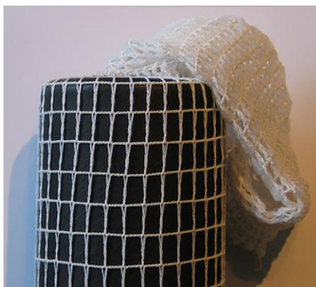
einlegen tuck knitting