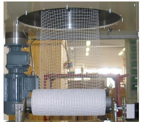
Wurzelballenverpackung Root ball packing