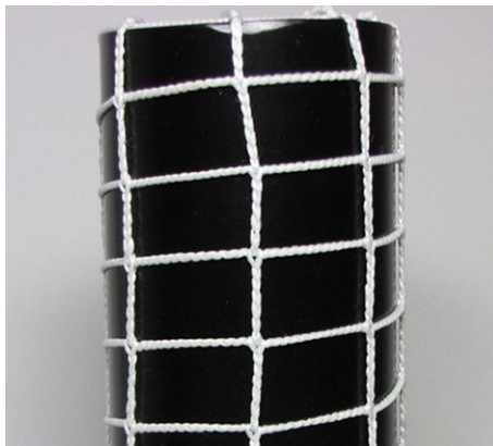
Kettfaden bis 5000 dtex Warp up to 5000 dtex