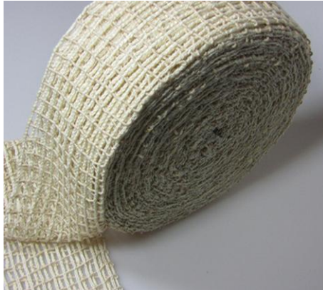
Schweinebratennetz Baumwolle Packing net for porkmeat