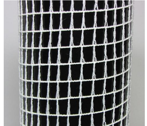
Schweinebratennetz Packing net for porkmeat