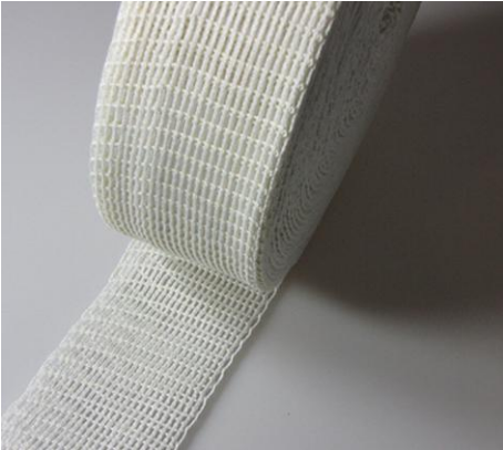
Schweinebratennetz Packing net for porkmeat