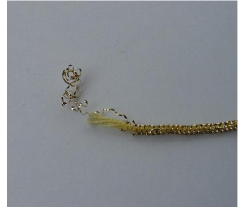
Umstricken mit Lurexfarben Knitting around w. Lurexcolouring