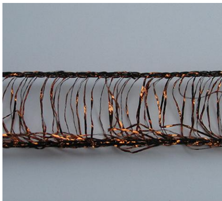
Lurexstrickgarn Lurex knitting yarn