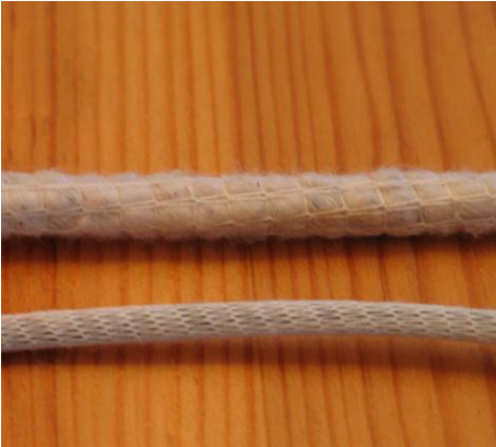
Umstricken einer Einlage Knitting around a core