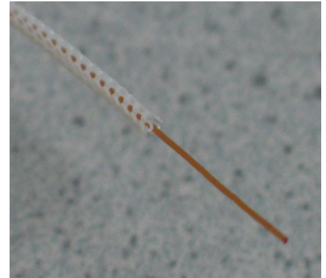
Umstricken mit Monofilament Knitting around with monofilament