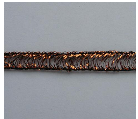
Lurexstrickgarn Lurex knitting yarn