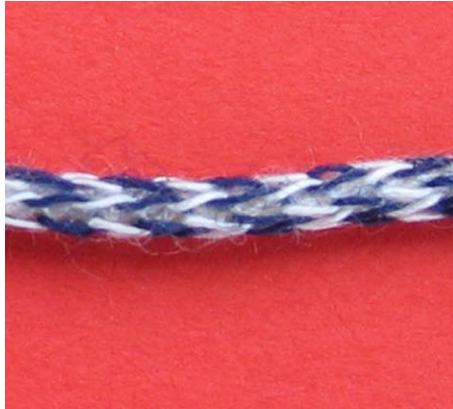
2-systemig stricken Knitting with 2 feeders