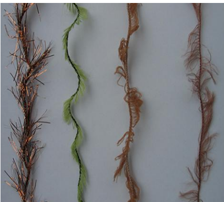
Fusselgarn Fluff yarn