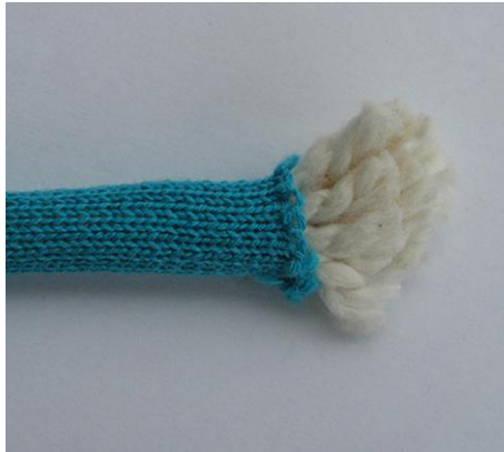
Umstricken einer Einlage Knitting around a core